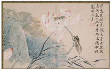
색감 복원 후