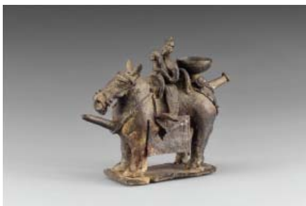
색감 복원 후