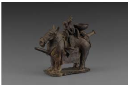
색감 복원 전