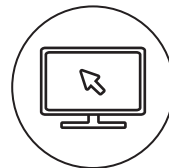
고문서, 고신문 디지털화

기관 보유 저작물 중 권리관계가 모호하거나 품질이 낮아 개방할 수 없는 저작물을 고품질의 저작물로 재촬영 및 복원해드립니다