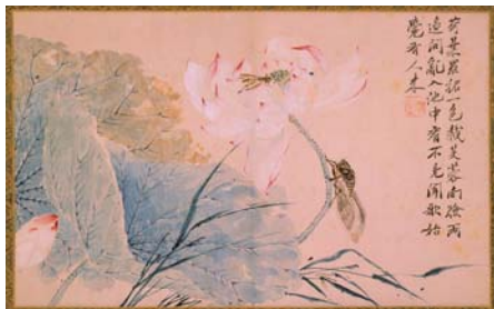
색감 복원 전