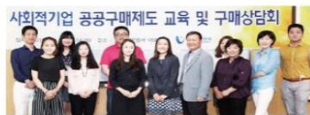
지난 22일 울산광역시에서 열린 여성·사회적기업 제품 구매교육 및 구매상담회 참가자들이 기념촬영을 하고 있다.