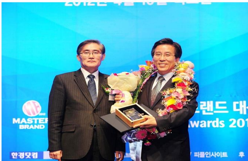
문경오미자대표브랜드 "레디엠" 2012대한민국 대표브랜드 대상 수상(4.19)

▶ 도서 기증식의 사진의 경우 기증자의 경우 사진의 이용가능성에 대하여 인식하고 있었음이 예상되므로 초상권 이용의 묵시적 동의가 있는 것으로 보고 1유형가능으로 처리