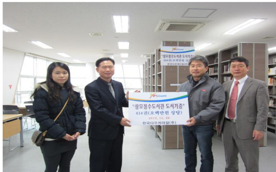
다우케미칼에서 작년에 이어 올해도 도서를 기증해주셨습니다